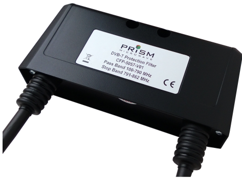
LTE 4G SUODATIN, CFP5057

26 maassa, Suomi mukaan lukien, LTE /4G palvelut ovat alkaneet tai ovat alkamassa 800 MHz taajuusalueella ja antennitalouksissa DVB-T -signaalit saattavat häiriintyä joko vähäisesti tai jopa hyvin vahvasti.